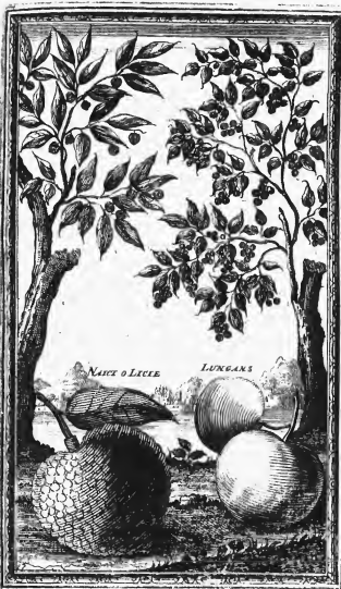
NAXI O LICIE